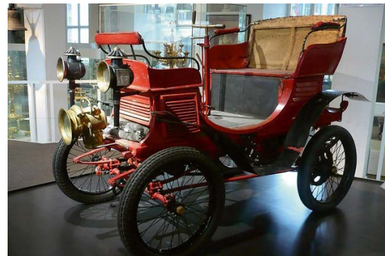
Kölner Motorwagen Vis-à-Vis, Kölner Motorwagen-Fabrik GmbH