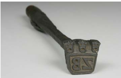
Brandsiegel der Heringsröder, 16. Jh.

Was ursprünglich zur Abwehr fremder Marken gedacht war, geriet schnell zu einem Qualitätssiegel. Die Erfindung der Warenkennzeichnung durch das britische Handelsmarktgesetz von 1887 war der Beginn der englischen Formel von »Made in ...«. Da waren Kölner Marken schon längst auf dem Weltmarkt vertreten und überzeugten durch Ihre Qualität, sei es als Eau de Cologne, Vier-Takt-Motor, Telegraphenkabel oder Schokolade. Viele Kölner Produkte folgten im 20. Jahrhundert, und noch heute zeugen eine Reihe von Unternehmen mit der Vertrieb ihrer Waren, dass sie Kölner Unternehmen sind und damit auch Köln in der Welt vermarkten.